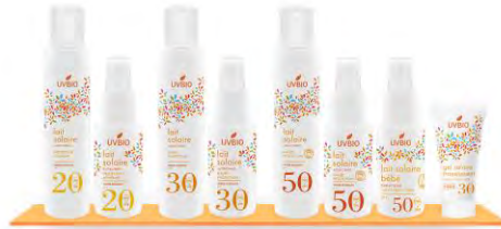
Bescherming tegen de zon